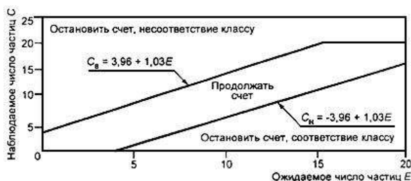
Рисунок F.1 - Границы соответствия и несоответствия классам чистоты при использовании метода последовательного отбора проб

На рисунке F.1 по оси абсцисс отложены значения ожидаемого числа частиц E , если концентрация частиц равна максимально допустимому значению для заданных размеров частиц и класса чистоты (B.4.2). По оси ординат отложены значения наблюдаемого числа частиц C_{\text{н}} в пробе.